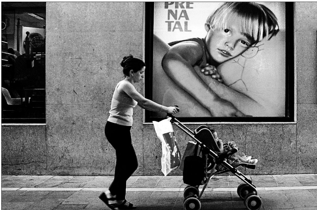
Una madre pasea a su hijo en el carrito. L.O.

Tienen más problemas para acceder a la inseminación artificial de la Seguridad Social y a la adopción