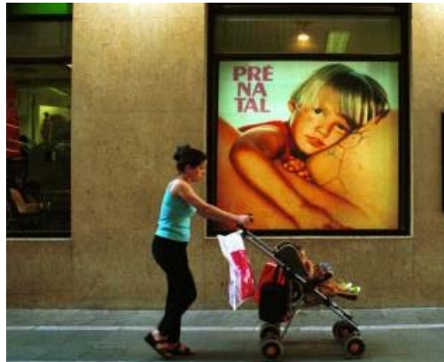
Una madre pasea a su hijo en el carrito.