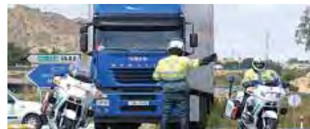
Las carreteras se han cobrado 500 muertos menos este año.

La asociación Stop Accidentes convocó en toda España actos para conmemorar la jornada y anunció que el presidente del Gobierno, José Luis Rodríguez Zapatero, había enviado un documento en el que manifiesta su prioridad de luchar contra la siniestralidad vial. “Seguiremos trabajando para