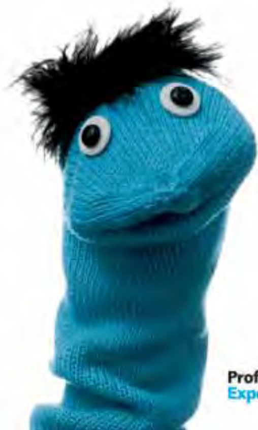
Profesor Karl Experto alemán en ahorro

MI COLEGA ZETTING TENER TARIFAS MÓVIL DABUTTEN. MIRAR PÁGINA SIGUIENTE.